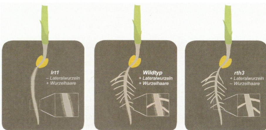
Abb. 1: Schematische Darstellung der Wurzelmutanten lrt1 (links) und rth3 (rechts) im Vergleich zu dem WT.

Die Ausprägung der Lateralwurzeln hat jedoch einen großen Einfluss auf die Entwicklung des gesamten Wurzelsystems (Abb. 3). Anhand von lrt1 lässt sich erkennen, dass die fehlende Wasseraufnahme durch fehlende Lateralwurzeln die Entwicklung des Wurzelsystems negativ beeinflusst. Die fehlende Bildung von Lateralwurzeln hat somit einen erheblichen Einfluss auf die gesamte Wurzelarchitektur der Pflanze, da sowohl Wasser- und Nährstoffaufnahme als auch der Informationsfluss gehemmt werden. Zwischen WT, lrt1 und rth3 besteht jedoch überraschenderweise kein signifikanter Unterschied im Trockengewicht in Sand. Das lässt sich durch die seitliche Ausdehnung der kortikalen Zellen und die dickeren Zellwände des Metaxylems, des Perizykels und der Markröhre bei lrt1 erklären, wodurch eine